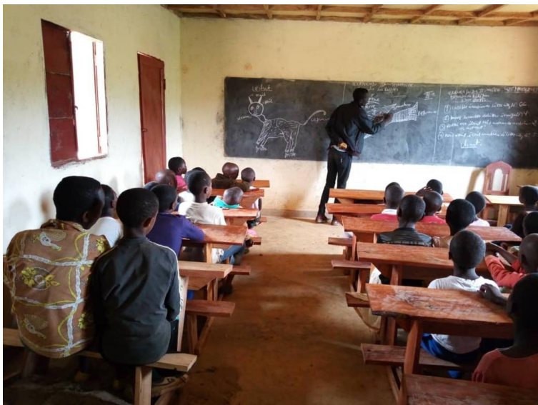
Abbildung 4: Projekt "neue Schule".

Es folgten weitere Projekte, wie zum Beispiel der Bau einer Schule unmittelbar neben einem Waisenhaus sowie die Übernahme von Schulgeld und die Bereitstellung von Stipendien für Waisen. Mit einem Video zeigten die „Entwicklungshelfer“ aus Münster, wie glücklich die Kongolesen über die Sachspende mobiler Solarleuchten waren, die ein deutsches Unternehmen dem Verein zur Verfügung gestellt hatte. Per Videobotschaft schilderte einer der Dorfältesten in Bantu und mit einem Ausdruck der Euphorie, dass nun die jungen Menschen auch abends nach Sonnenuntergang eine zuverlässige Lichtquelle haben, um die Hausaufgaben für den