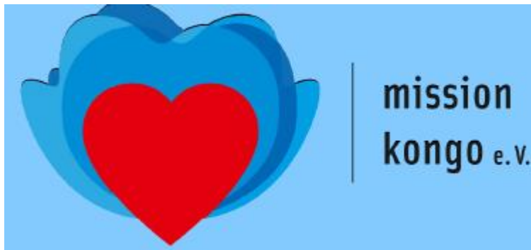
Abbildung 6: Logo des Vereins.

nächsten Schultag erledigen zu können. Petroleum sei manchmal nicht zu kaufen, dann gäbe es eben kein Licht. Ein Solarpanel funktioniere hingegen immer, denn Sonne gäbe es ja hier in der Nähe des Äquators ausreichend.