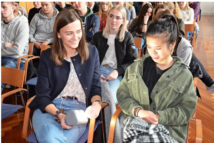
Abbildung 5: Schülerinnen probieren Solarleuchte aus.

Erstausrüstung des Internet Cafés vor Ort wurden die drei Münsteraner von hiesigen Unternehmen aus der Versicherungs- und IT-Branche unterstützt.