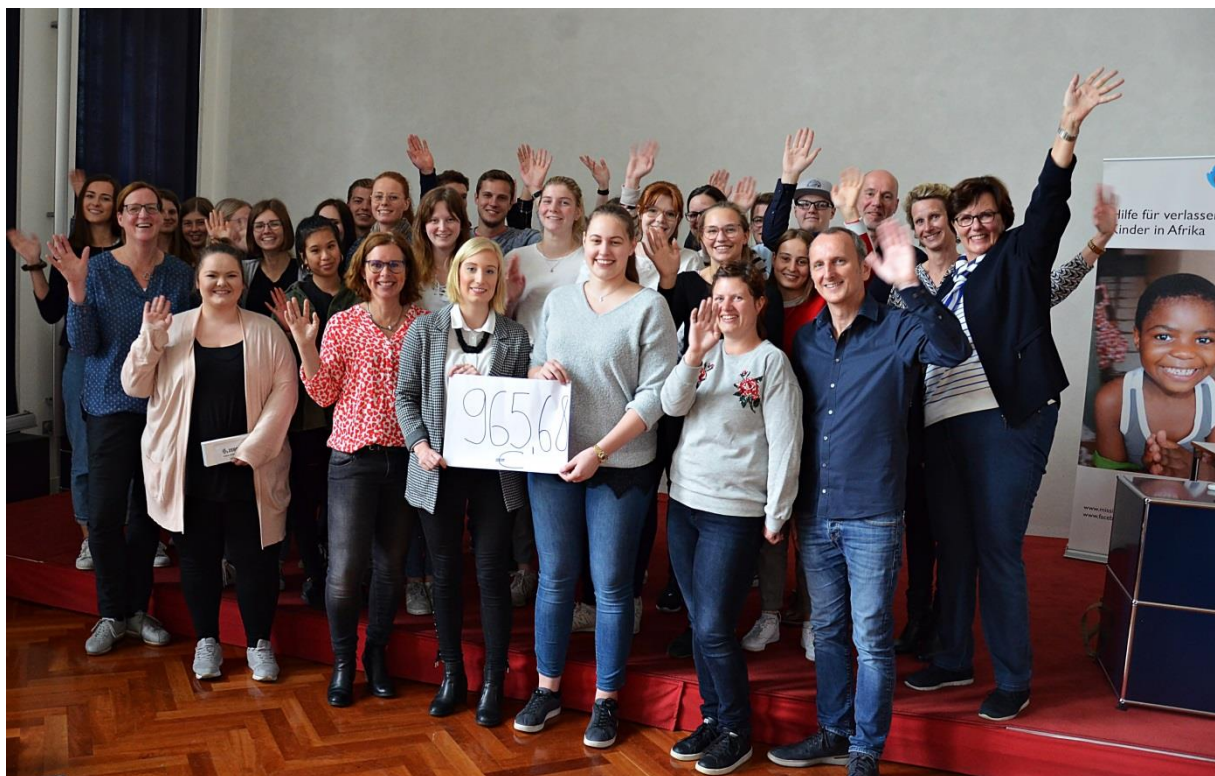
Abbildung 7: Spendenübergabe an Mission Kongo e.V.

sammensetze, im Kampf um die Staatsmacht und den Zugang zu den Rohstoffen nicht zur Ruhe komme. Erbittert geführte Bürgerkriege bringen das Land immer näher an den Abgrund. Die blutigen Auseinandersetzungen im Landesinnern und an den Grenzen bezeichnete Hülsing als große humanitäre Katastrophe. Leidtragende seien Hunderttausende kongolesischer Kinder, die ihre Eltern entweder durch Vertreibung oder durch Tod verloren haben.