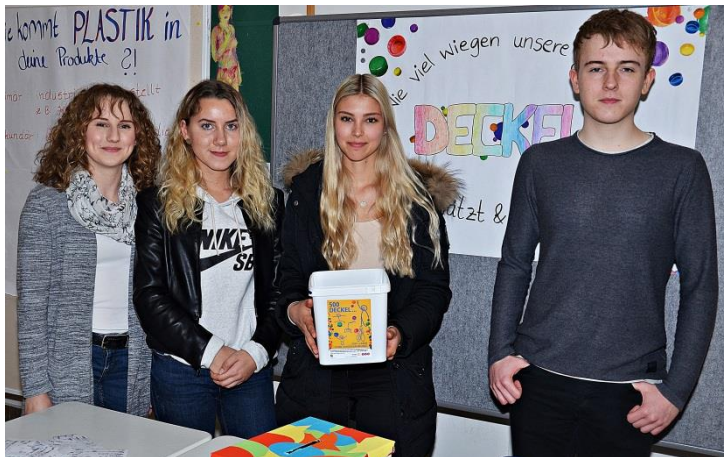
Abbildung 1: Deckelaktion am Hansa-Berufskolleg.

166 kg Deckel von Plastikflaschen sammelten die Schülerinnen und Schüler des Hansa-Berufskollegs in den letzten Monaten und finanzierten rund 500 Schutzimpfungen 1 gegen Kinderlähmung, auch Polio genannt.